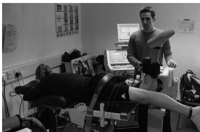
Fig. 2. Posición de valoración en decúbito prono con cadera fijada a 0^\circ de flexión y cabeza en posición neutra.

En cada sesión experimental, únicamente la pierna dominante fue evaluada 54 . Todos los participantes adoptaron como posición de valoración la de decúbito prono sobre la camilla del dinamómetro con cadera fijada a 0^\circ de flexión y cabeza en posición neutra (fig. 2) 55,56 . La posición de tendido prono ( 0^\circ de flexión de cadera) fue seleccionada en lugar de la extensivamente utilizada posición de sentado ( 80 - 110^\circ de flexión de cadera) por dos razones principales: