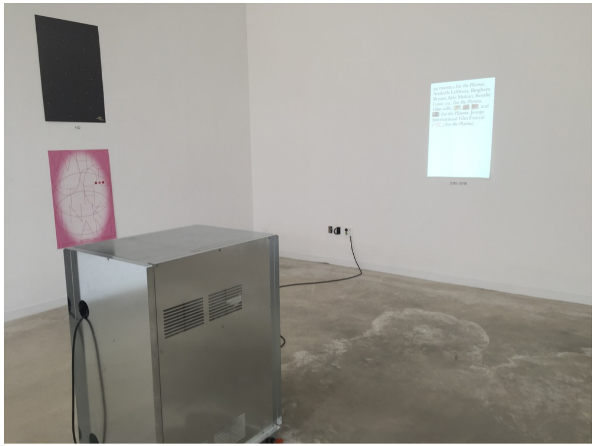
Projection of Posters