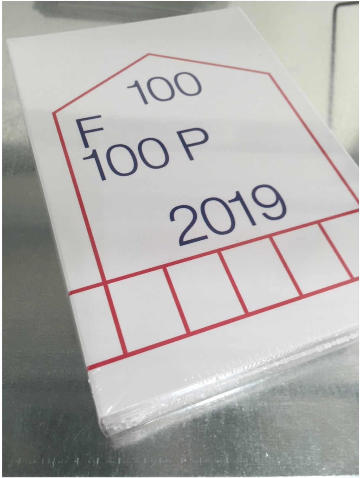
Gallery Catalogue (front cover)